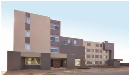
外観/土地建物の所有形態：事業主体非所有